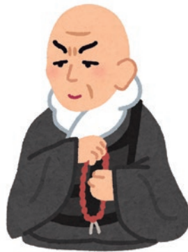
浄土宗宗祖 法然上人 (1133~1212)